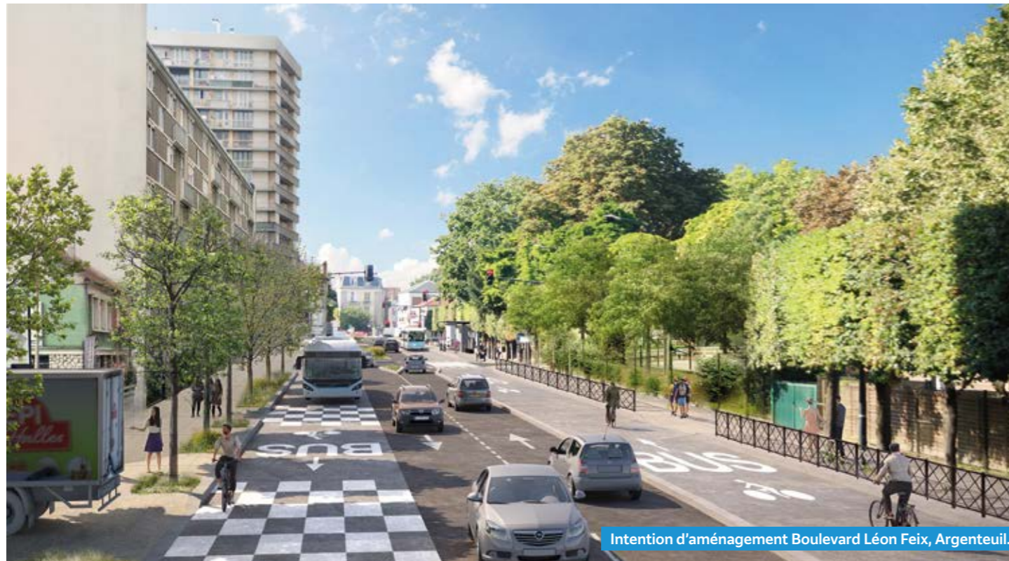
Intention d'aménagement Boulevard Léon Feix, Argenteuil.