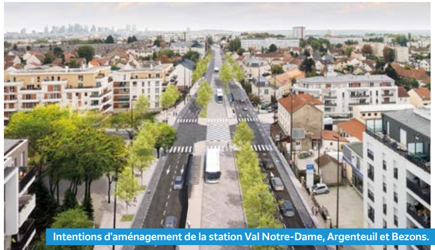
Intentions d'aménagement de la station Val Notre-Dame, Argenteuil et Bezons.

L a déclaration d'utilité publique du projet Bus Entre Seine est bien plus qu'une étape administrative. Prononcée le 31 août 2022 par les préfets du Val d'Oise et des Yvelines, elle annonce la désignation des entreprises de maîtrise d'œuvre et le prochain démarrage des travaux.