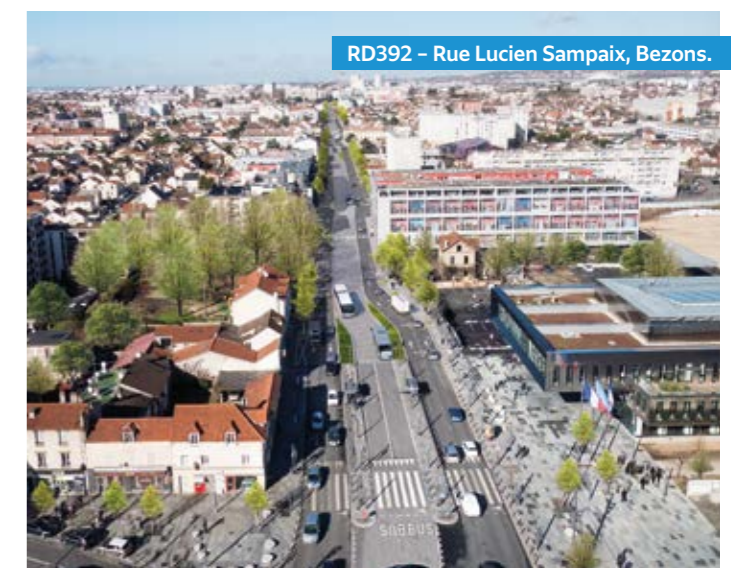
RD392 - Rue Lucien Sampaix, Bezons.

Le dispositif d'information mis en place au début du projet est maintenu. La concertation avec les habitants et les usagers des transports en commun se prolongera sous la forme rendez-vous d'information. Le site internet du projet Bus Entre Seine sera mis à jour jusqu'à la mise en service.